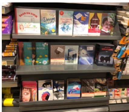
foto: boekenplanken met onze titels bij de Spar in Echtenerbrug, Friesland

Plankruimte kost geld. Wat is daaraan te doen?